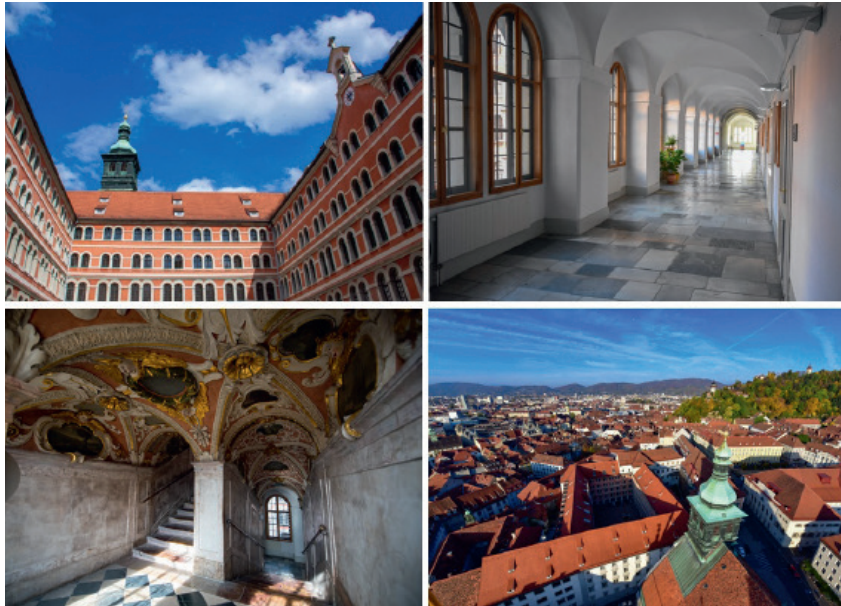
Priesterseminar Graz