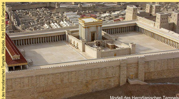
Modell des Herodianischen Tempels

„Der Eifer für Dein Haus verzehrt mich“ – was uns der biblische Tempel heute noch zu sagen hat